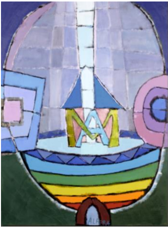
« Arche », huile sur toile, 114 x 146 cm Gilles ALFERA, peintre et graveur, Neauphle le Château (78) http://www.alfera.org