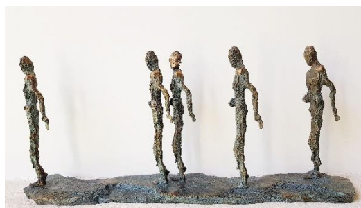
« La marche des Moines », bronze, 83 x 40 x 15 cm Catherine VILLA, Fourqueux (78) https://www.catherinevilla.com/