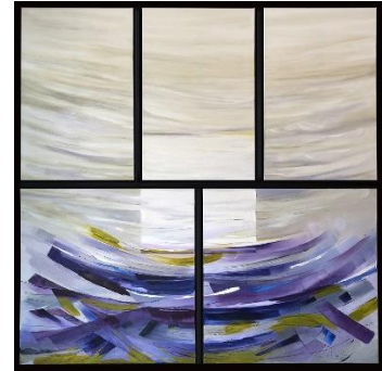
« Entre ciel et terre », 200 x 200 cm Macildo, peintre, St Victor la Coste (30) http://sylvedauchet.fr/