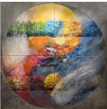
« Le Sentier », 160 x 160 cm CHUNG-HING, poète et peintre, Hong-Kong / Paris http://chunghing.free.fr/