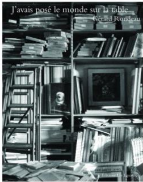
Dernier livre paru : « J'avais posé le monde sur la table », novembre 2015

« Rondeau voyage dans un monde en noir et blanc, il emprunte des chemins sans fin, joue avec les mots, les jeux d'ombre et les silences, il assemble des histoires et restitue des mondes en souffrance. » (source : gerardrondeau.com)