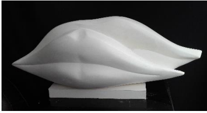
« Les silences », résine, 60 x 20 x 22 cm Franceleine DEBELLEFONTAINE, sculptrice, Paris http://www.franceleine.com/