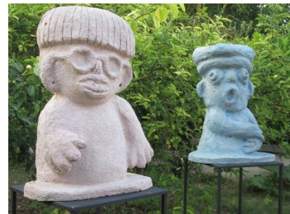
« Dialogue de sages dans un jardin de paix », Béton, h80 cm (détail) Anne-Marie DE PASQUALE, sculptrice, Reims http://www.amdepasquale.com/