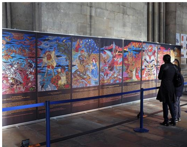
« Apocalypse », Cathédrale de Reims 2011

Frédéric Voisin vit et travaille à Reims depuis 2000; diplômé de l'école nationale supérieure des arts appliqués, il se consacre maintenant exclusivement à la gravure après avoir été reconnu pour ses illustrations dès les années 80 dans le monde de l'industrie musicale.